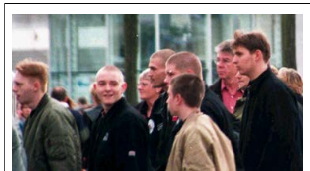
Neonazi-Szene aus Rhein-Main bei Mahler-Kundgebung, 2000