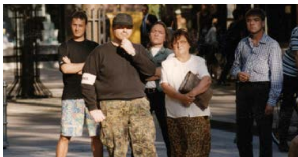
Kundgebung der „Bürgerinitiative für unser Land“ um Horst Mahler, 1999