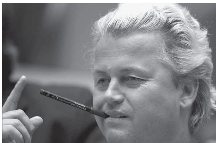
Geert Wilders: Mit Mozart-Frisur gegen Kopftücher.

Im April 2010 rief die PVV ihre «Agenda für Hoffnung und Optimismus» ins Leben, die sich hauptsächlich um Sicherheitsbelange und den Islam dreht. Sie fordert härtere Strafen, 10'000 zusätzliche Polizisten, eine Einschränkung des Entscheidungsspielraums der Richter sowie ein Koran- und Burka-Verbot, einen Einwanderungsstopp für Personen aus islamischen Ländern, keine soziale Unterstützung für Immigrantinnen und Immigranten für die ersten zehn Jahre, eine «Kopftuch-Steuer» oder die Schliessung islamischer Schulen, um nur einige der abstrusen Ideen zu nennen. Ausserdem verlangt die PVV eine «ethnische Registrierung» aller Bürgerinnen und Bürger – und stellt somit die Loyalität der Doppelbürgerinnen und -bürger in Frage. Wilders richtete sein Programm neu