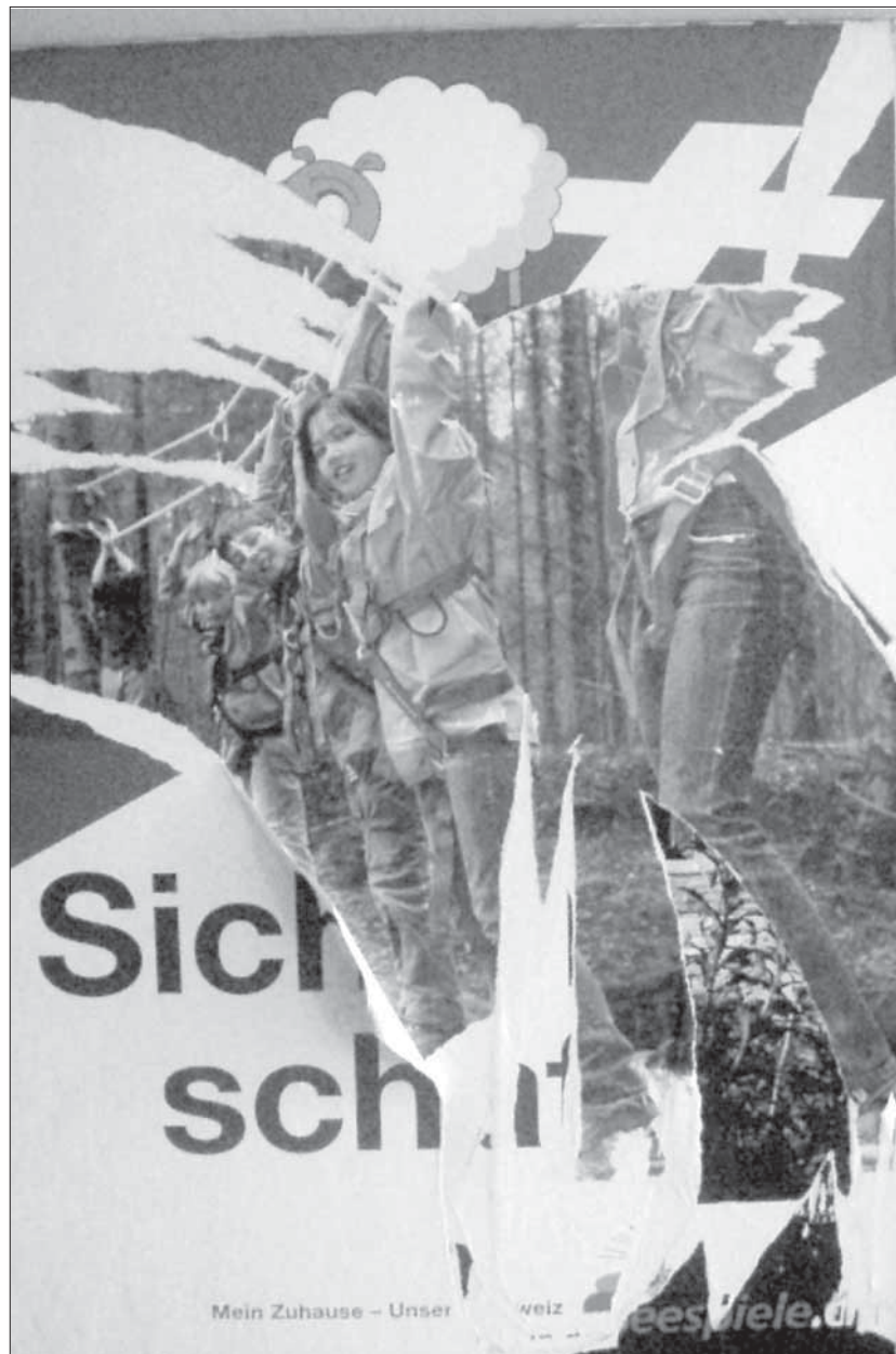
Widerstand im Kleinen.

Die SVP wurde am 22. September 1971 gegründet, als sich die Bauern-Gewerbe- und Bürgerpartei (BGB) und die Demokratischen Parteien der