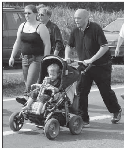
Familie Rechsteiner in Aktion.

Die rechtsextreme, im Oberaargau und ländlichen Luzern beheimatete «Helvetische Jugend» – das Kürzel HJ stand einst auch für die Hitler-Jugend – konnte ihr Aktionsfeld markant ausweiten. Seit dem 21. Juni 2009 verfügt die HJ über einen Ableger im Berner Oberland und betätigt sich mehr denn je als Jugend- und Vorfeldorganisation der PNOS. Der «Nationale Beobachter» definierte in einem Bericht zur Gründungsfeier die Rolle der HJ so: «Unser Nachwuchs im Berner Oberland wird von nun an hauptsächlich in die Kameradschaft der HJ Oberland integriert werden und politisch der örtlichen PNOS-Sektion angehören.» Gemeinsam mit der Mutterpartei führte die HJ am 14. November denn auch in Thun, Spiez und Einigen eine Flugblattaktion zur Minarett-Initiative durch.