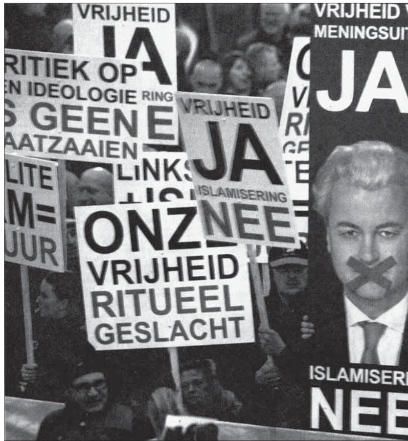
Amsterdam 2010: Proteste für Wilders.

Bei den nationalen Parlamentswahlen im Juni 2010 gelang es Wilders PVV, einen Coup zu landen: Die Partei gewann 24 Parlamentssitze und ist neu die drittstärkste Partei der Niederlande. Über 1,5 Millionen Menschen wählten die PVV. Geert Wilders bemühte sich intensiv, Teil der neuen Regierung zu sein und den Einzug der sozialdemokratischen PvdA zu verhindern. Nicht nur in der Anti-Islam-Agenda, sondern auch in wirtschaftspolitischen Fragen unter-