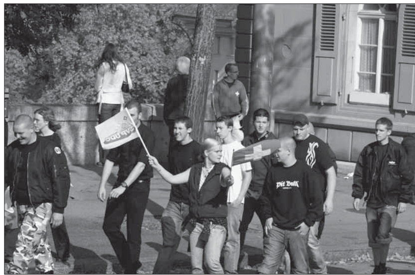
Neonazis zeigen Flagge: SVP-Veranstaltung am 6. Oktober 2007 in Bern.

Im Oktober 2009 trat Baettig als Referent an einem rechtsextremen Kongress in der südfranzösischen Stadt Orange auf. Er behauptete danach, im Vorfeld nichts vom rechtsextremen Charakter der Veranstal-