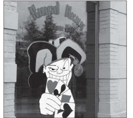
Der Joker hat ausgegrinst.

Die Lichter der «Royal Aces Tattoo-Bar» bleiben somit bis auf weiteres aus. Und es macht nicht den Anschein, als wären die Rechtsextremen gewillt, den Entscheid an eine nächst höhere Instanz weiter zu ziehen.