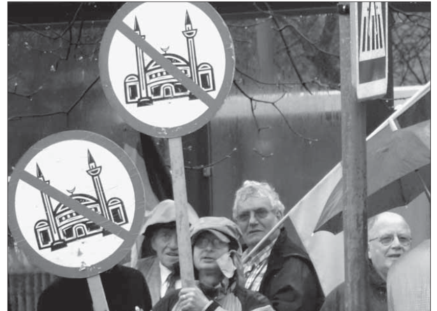
Minarett-Debatte eint die europäische Rechte. «Pro-Bewegung» in Essen.

eigenen Reihen aufzunehmen. Rechtsextremes Gedankengut fliesst so in die Ideologie der Partei ein und wird einem breiteren Publikum zugänglich.