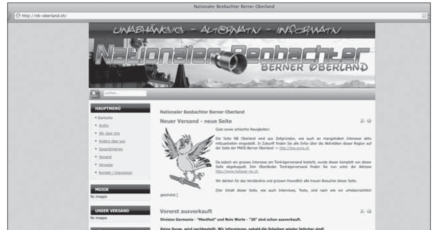
Das Online-Portal «Nationaler Beobachter» ist eingeschlafen.