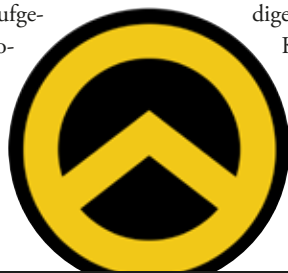
Das von der Identitären Bewegung verwendete Lambda-Symbol