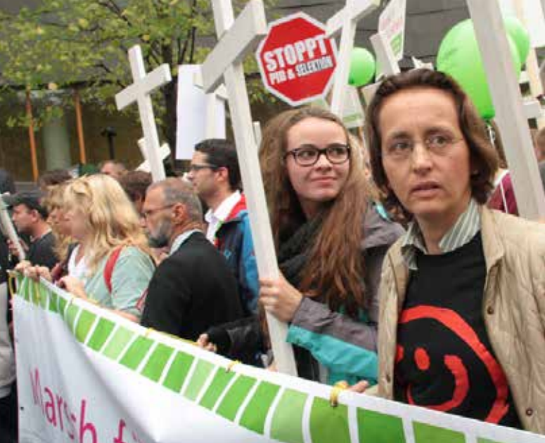
AfD-Chefin und Lobbyisten der AntifeministInnen: Beatrix von Storch beim „Marsch für das Leben“ 2014 in Berlin